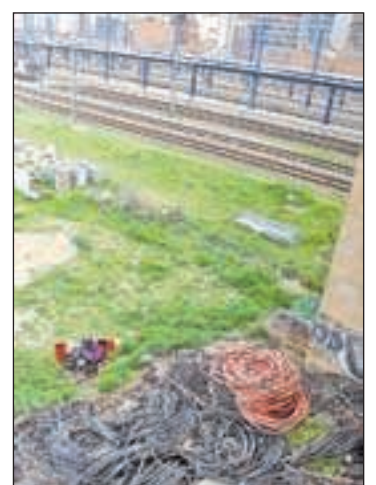
Els cables amuntegats al terreny propietat d'Adif

Adif està prenent les mesures necessàries per condicionar el solar dins de l'estació Lleida-Pirineus. L'entitat pública va dir que està pendent de què l'empresa Emfesa, que tracta el material ferroviari en desús, retiri els cables procedents d'un treball d'envergadura realitzat el desembre del 2020, per dur a terme les tasques de neteja i desbrossament de la zona.