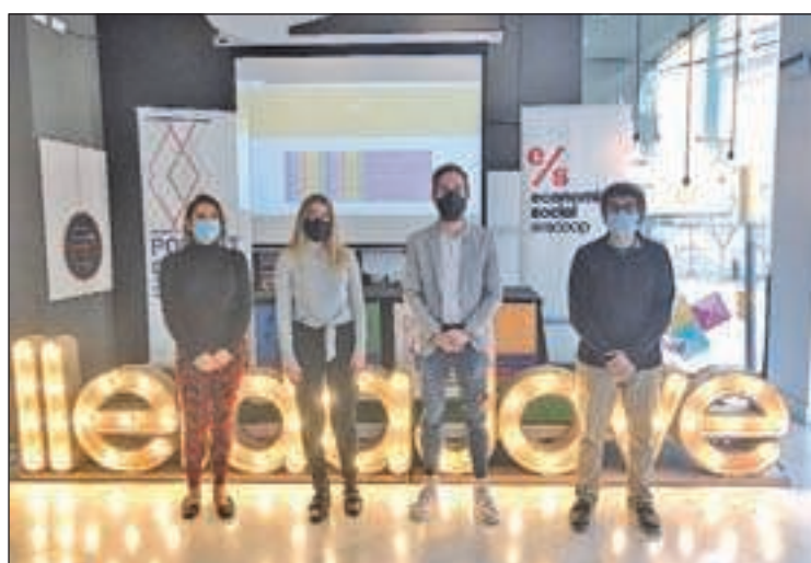
Representants de Ponent Cooperera i la Paeria

La Regidoria de Joventut i Ponent Cooperera impulsen Fem Coop , un projecte de nova creació que vol impulsar l'emprenedoria i l'autoocupació dels joves mitjançant la creació de cooperatives que fomentin valors de justícia social, consum responsable, sostenibilitat i que proposin solucions innovadores per als reptes socials.